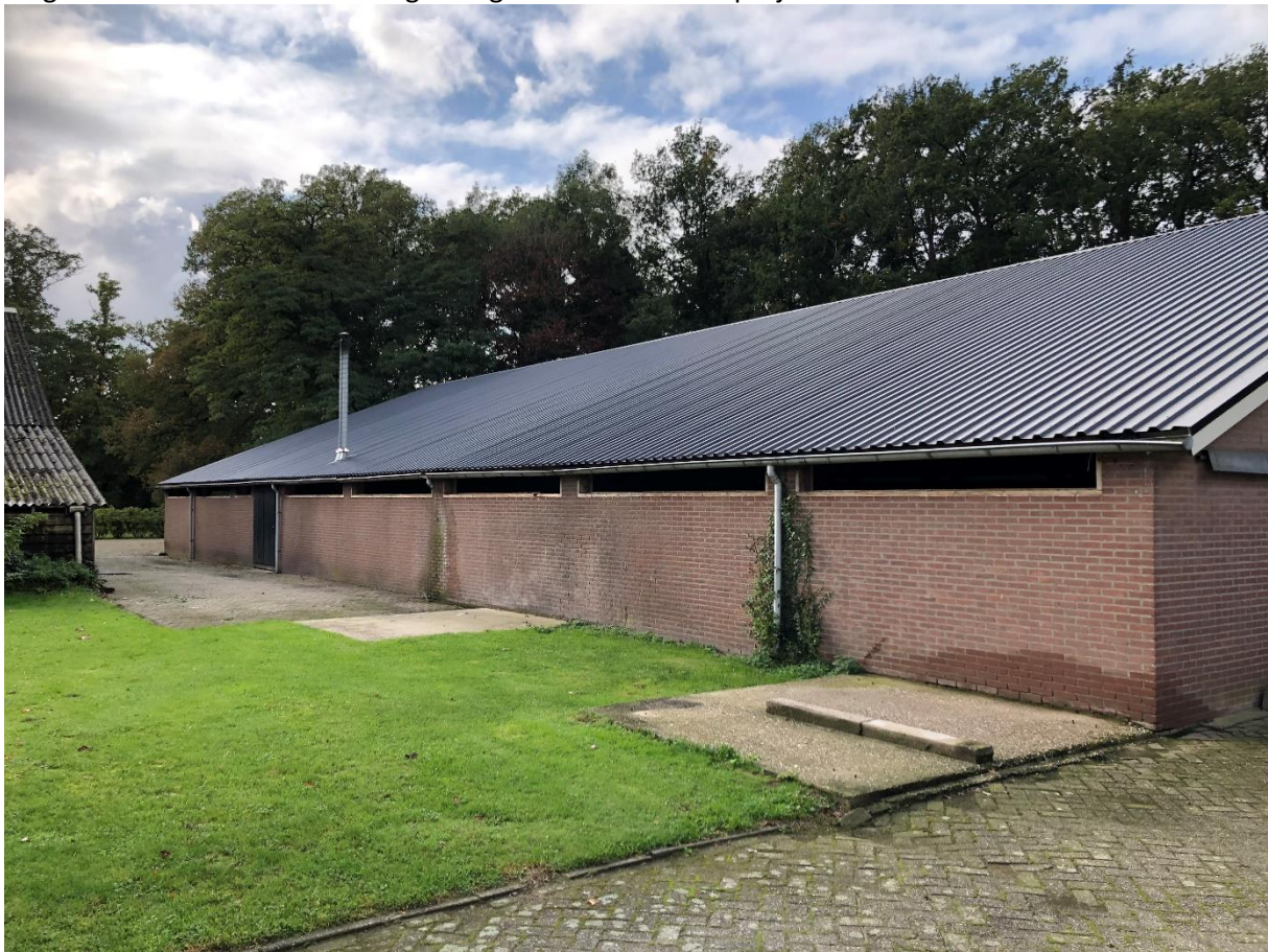
Stal met dak waarop de zonnepanelen komen. Bloemendaallaan 110 Barneveld

Energie Coöperatie Duurzaam Kootwijkerbroek is gevraagd het project Asbest eraf Zon erop in Barneveld uit te voeren. Dit is een concept dat door Vallei Energie en de Provincie Gelderland is ontwikkeld. Het doel is het gevaarlijke asbest verwijderen en duurzame energie opwekken door zonnepanelen op het nieuwe dak. Vallei energie verzorgt de opstart van het project. De provincie betaalt de uren en Duurzaam Kootwijkerbroek krijgt een duurzaamheid subsidie als er tenminste 50 deelnemers zijn. De gemeente Barneveld geeft een duurzaamheid subsidie. De dak eigenaar krijgt van de coöperatie een vergoeding voor het verwijderen van het asbest. De duurzaamheidslening van de gemeente Barneveld kan aangevraagd worden voor dit project!